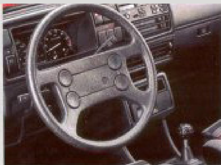
Das Cockpit.

Voilà – der Innenraum des GTI. Schon von außen zu sehen: die neuen Sitzbezüge in elegantem Blockstreifen-Dessin. Ebenso geschmackvoll wie die Seitenverkleidung. Die körpergerecht geformten Sportsitze vorn sind sehr bequem, und – was noch wichtiger ist – sie geben Ihnen während der Fahrt den notwendigen Halt. Auch sonst läßt die sportlich-exklusive Innenausstattung nichts zu wünschen übrig. Das umschäumte Vierspeichen-Sportlenkrad zum Beispiel. Sehr griffig. Und der Außenspiegel? Den können Sie von innen einstellen. Oder der Heckscheibenwischer. Jetzt mit Intervallschaltung.