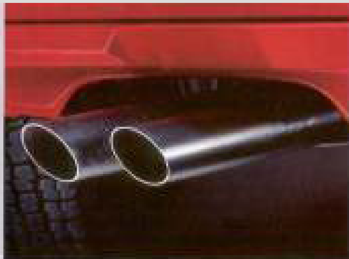
Das Einzelbild zeigt den Auspuffkopf.

Wir haben den GTI jetzt noch attraktiver gemacht. Was direkt ins Auge fällt: der neue Doppelscheinwerfergrill mit Zusatz-Fernscheinwerfern. Und an den Seiten: schwarze Schweller und breite Stoßprofileisten, die ebenso wie die Stoßfänger einen roten Zierstreifen haben. Nicht zu vergessen das neue, sportliche Auspuff-Doppeldrohr. Es stimmt: der GTI ist optisch noch dynamischer, noch souveräner geworden. Eine Augenweide nicht nur für den Kenner.