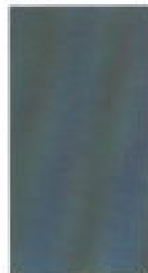
Ursa metallic* W1