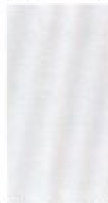
Diamantsilber met* Z4