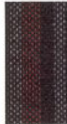
Grandprix o/ Rot KR